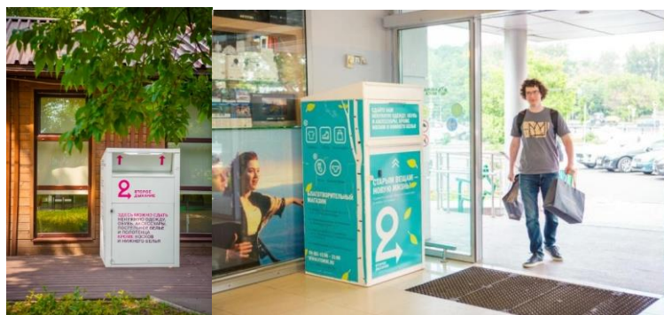
Рис. 4. Контейнеры фонда «Второе дыхание»