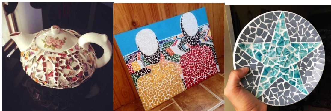
Рис. 7. Работы мастерской эко-мозаики «Зайка-мозаика»

Цель проекта «Зайка-мозаика» – дать шанс вещи на вторую жизнь, но уже в новом качестве (Рис. 7). Своими работами дизайнер старается обратить внимание людей на свое потребление, хочет, чтобы они больше задумывались об экологии и сознательно относились к идее вторичной переработки.