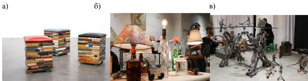
Рис. 1. Примеры апсайклинг: а - изделия из запчастей и инструментов (игрушки, подставки, предметы интерьера), б – светильники и другие интерьерные вещи из водопроводных труб, бутылок, в – стулья из книг

У скандинавов, поддерживающих экологичное и разумное потребление, эта тенденция получила живой отклик. Во-первых, это практично – нет необходимости покупать новые предметы, когда можно использовать старые. Во-вторых, это дает возможность разнообразить свой интерьер и творчески подойти к оформлению дома.