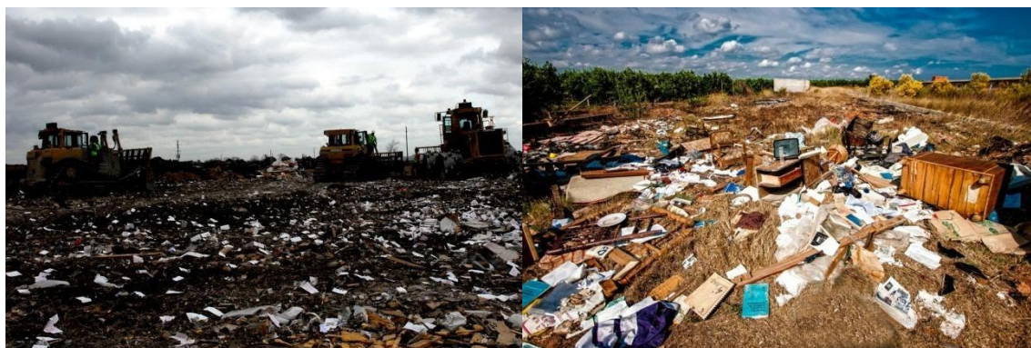
Рис. 2 Изображения свалок России

Текстиль — слишком дешевая фракция, требующая большой подготовительной работы, и его переработка нерентабельна, поэтому коммерческие компании/фирмы, которые принимают на переработку пластик и макулатуру не берутся за решение данной проблемы.