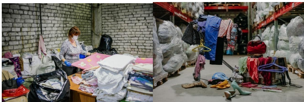
Рис. 3. Фонд «Второе дыхание» собирает, сортирует, перераспределяет и перерабатывает одежду

Команда фонда «Второе дыхание» уже несколько лет собирает, сортирует, перераспределяет и перерабатывает одежду. В пяти городах России – Москве, Казани, Костроме, Ярославле и Ростове Великом – работают 90 сотрудников фонда, установлено 120 контейнеров, проведено около 500 акций по сбору одежды. С 2016 года по март 2020 фонд собрал более миллиона 400 тыс. кг одежды. Сервисами «Второго дыхания» пользуются более 200 тыс. человек (Рис. 3.) [4, 5].