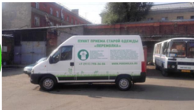
Рис. 5. Пункт приема старой одежды «Перемолка»

Крупные магазины поддерживают экологическую политику (Рис. 6.).